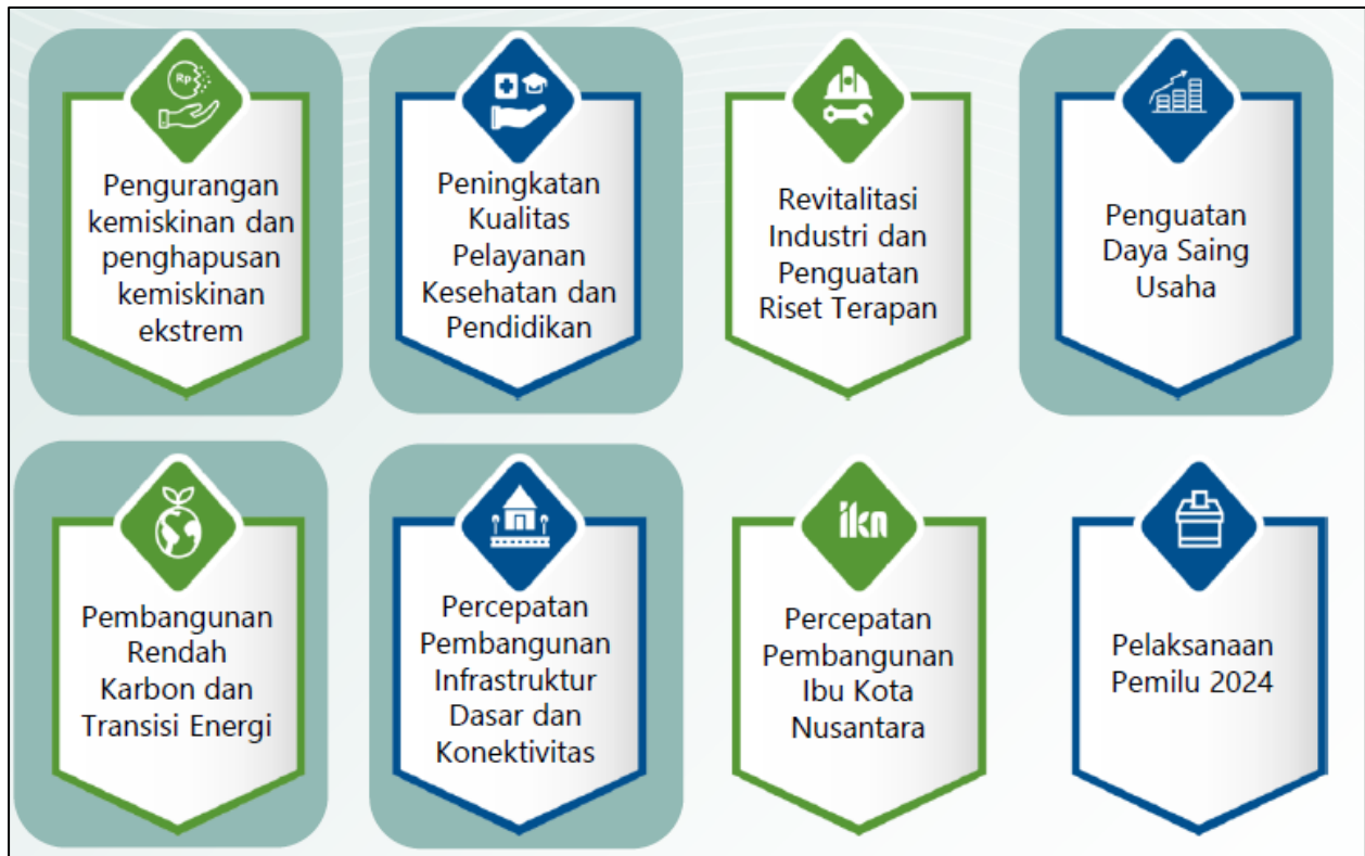
Gambar 3.1 Arah Kebijakan RKP Tahun 2024

Pada Tahun 2024, Tema Pembangunan Nasional yang ditetapkan dalam RKP Tahun 2024 adalah "Mempercepat Transformasi Ekonomi yang Inklusif dan Berkelanjutan" dengan 8 arah kebijakan sebagai berikut: